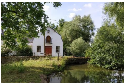
Moulin Dussart (11)