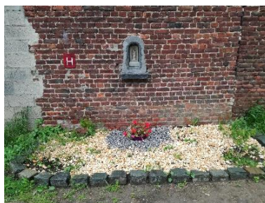
Potale à la Ste Vierge (10)