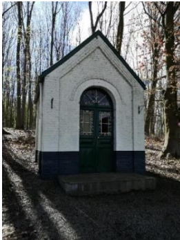
Chapelle N-D de Lourdes (4)