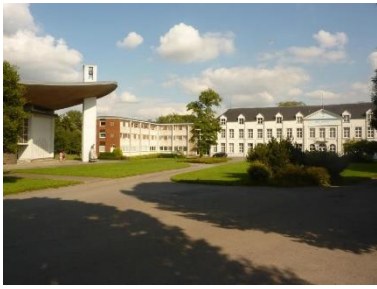
Mémorial KONGOLO (1)

PS : Le parcours ne traverse pas le village de VILLEROUX