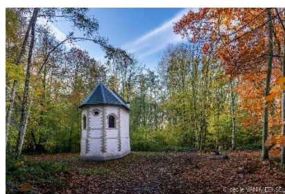
Chapelle N-D de l'Ermitage (13)