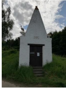
Chapelle St Antoine l'Ermite (2)