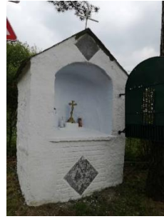
Chapelle Sainte-Anne (3)