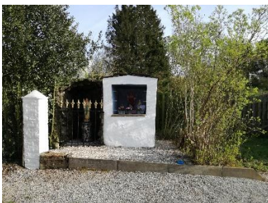
Reposoir du Sacré-Cœur (9)