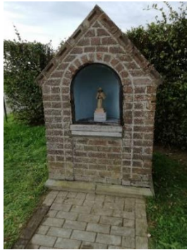
Chapelle St Fiacre (5)