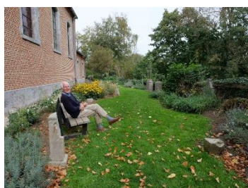
Le Jardin des Songes (12)