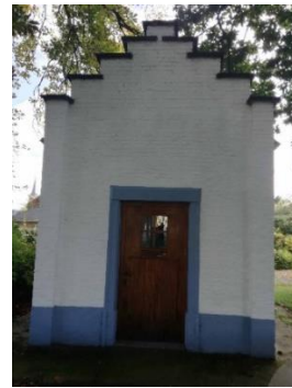
Chapelle Ste Adèle à St GERY (6)