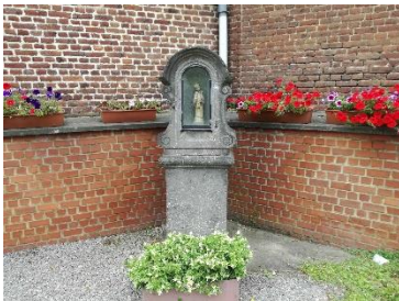
Borne-Potale de St GERY (7)